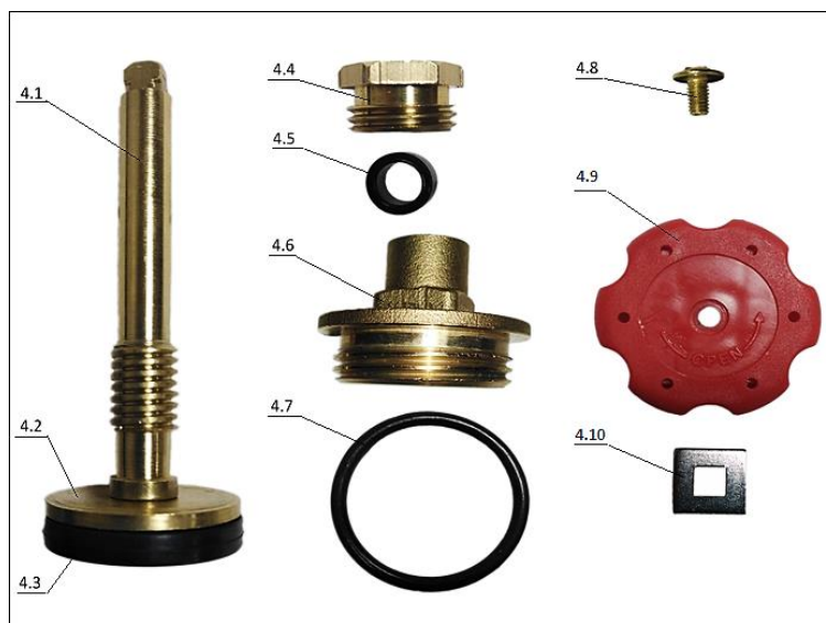
Рисунок 3. Конструкция вентиля вентильной головки